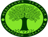
ТАБЛИЦА ДОПОЛНИТЕЛЬНОГО ТУРНИРА проводимого по олимпийской системе PORSCHE TENNIS CUP