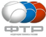
ТАБЛИЦА ДОПОЛНИТЕЛЬНОГО ЛИЧНОГО ТУРНИРА РТТ на 32 участника

Первенство Самарской области среди юношей и девушек в закрытых помещениях по теннису